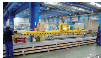
Palonnier à ventouses de capacité trois tonnes pour manutention de plaques d'aluminium.

7 % à la R&D entame un 5 e plan Anvar/Oséo. "Au fur et à mesure des plans, nous intégrons nos innovations ou optimisations dans les produits afin d'en faire bénéficier tous les secteurs d'activité", complète Stéphane Garcia.