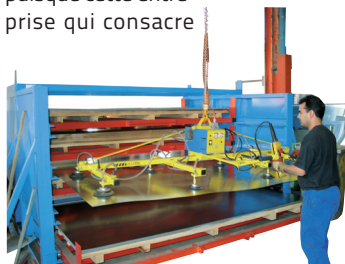
Palonnier à ventouses de capacité 300 kg pour manipulation de tôles fines.

L'une des particularités de Coval relève de sa dynamique d'innovation puisque cette entreprise qui consacre