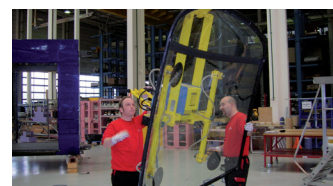
Manutention verticale de pare-brise de train.

mesure des plans, nous intégrons nos innovations ou optimisations dans les produits afin d'en faire bénéficier tous les secteurs d'activité", poursuit Stéphane Garcia. Selon les besoins des clients, Coval fournit des produits standards ou développe des solutions sur mesure. "Pour le centre de maintenance de la SNCF à Tours (EIMM), nous avons élaboré des appareils à la demande", précise Stéphane Garcia. Outre la fourniture des solutions, Coval installe ses produits et forme, sur site, les opérateurs chargés de les mettre en œuvre. Pour d'autres applications, Coval dispose aussi de tubes de levage et d'une gamme standard Vac'easy, très compétitive en terme de prix. ■